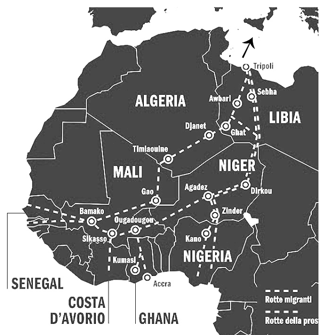
Principali rotte migratorie dall'Africa subsahariana all'Europa

Le condizioni di vita nei campi sono state descritte da più parti come aberranti: decine e decine di esseri umani ammassati in spazi angusti, sporchi, privi di luce e ventilazione. Assenza di assistenza sanitaria e legale, di servizi igienici, scarsità di cibo, acqua e medicinali rappresentano in questi luoghi una costante. Inoltre le violenze, gli stupri ed i soprusi sono all'ordine del giorno: le testimonianze raccolte negli ultimi anni raccontano una quotidianità fatta di percosse, ustioni, scariche elettriche e "torture da sospensione" (che consistono nell'appendere l'internato per le braccia o per le gambe per lungo tempo).