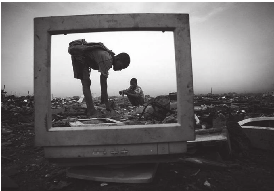
Avvertenza per chi legge: se non meglio specificato dove il genere è utilizzato al maschile è da intendersi anche al femminile. La lingua italiana conserva anche nella sua grammatica la dominanza del maschile sul femminile che ritroviamo nell'intera società.