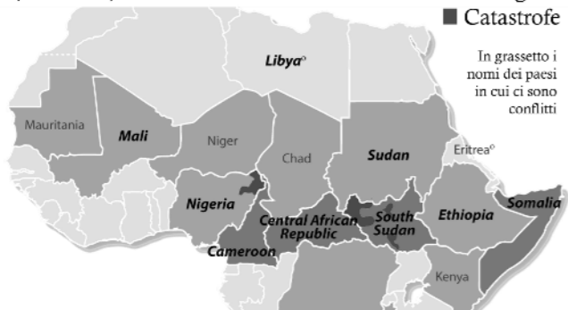
CARESTIE E CONFLITTI IN AFRICA (Feb. 2017)

Facendosi suggestionare da alcune perturbazioni provenienti dal Belgio e da Monaco, ritroviamo quindi attorno a noi la responsabilità dei massacri ecologici e sociali su cui ci illudiamo di non poter intervenire.