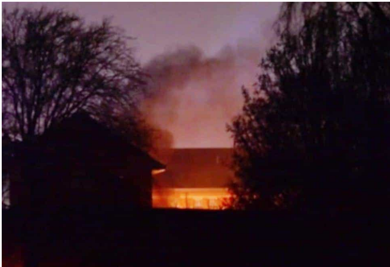
Fumo e fiamme che si alzano dal carcere durante la rivolta di 15 ore del dicembre 2016

Nelle udienze di tribunale per i 6 detenuti che sono stati accusati di essere gli “ istigatori ” è stato affermato che ammontano 6 milioni di sterline i danni fatti nella rivolta di 15 ore alla HMP Birmingham , che ha impietrito lo stato e la feccia di G4S, la società privata che gestisce la prigione. Tutti i prigionieri sono stati condannati per “ ammutinamento ” per aver dato inizio ad una rivolta che ha portato al tentativo di evasione di 500 prigionieri dalle celle grazie alle chiavi sottratte ad un secondino, ha coinvolto 4 ali dell’edificio e causato “ distruzioni su larga scala ”.