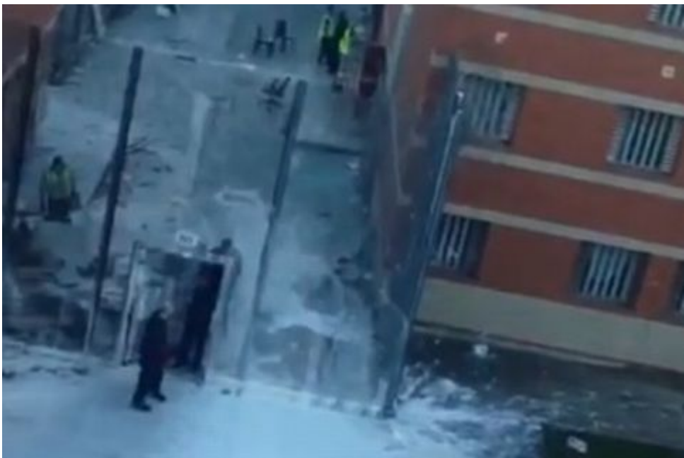
Condannati gli "istigatori" della rivolta nel carcere di Birmingham

https://roundrobin.info/2017/10/condannati-gli-istigatori-della-rivolta-nel-carcere-birmingham/