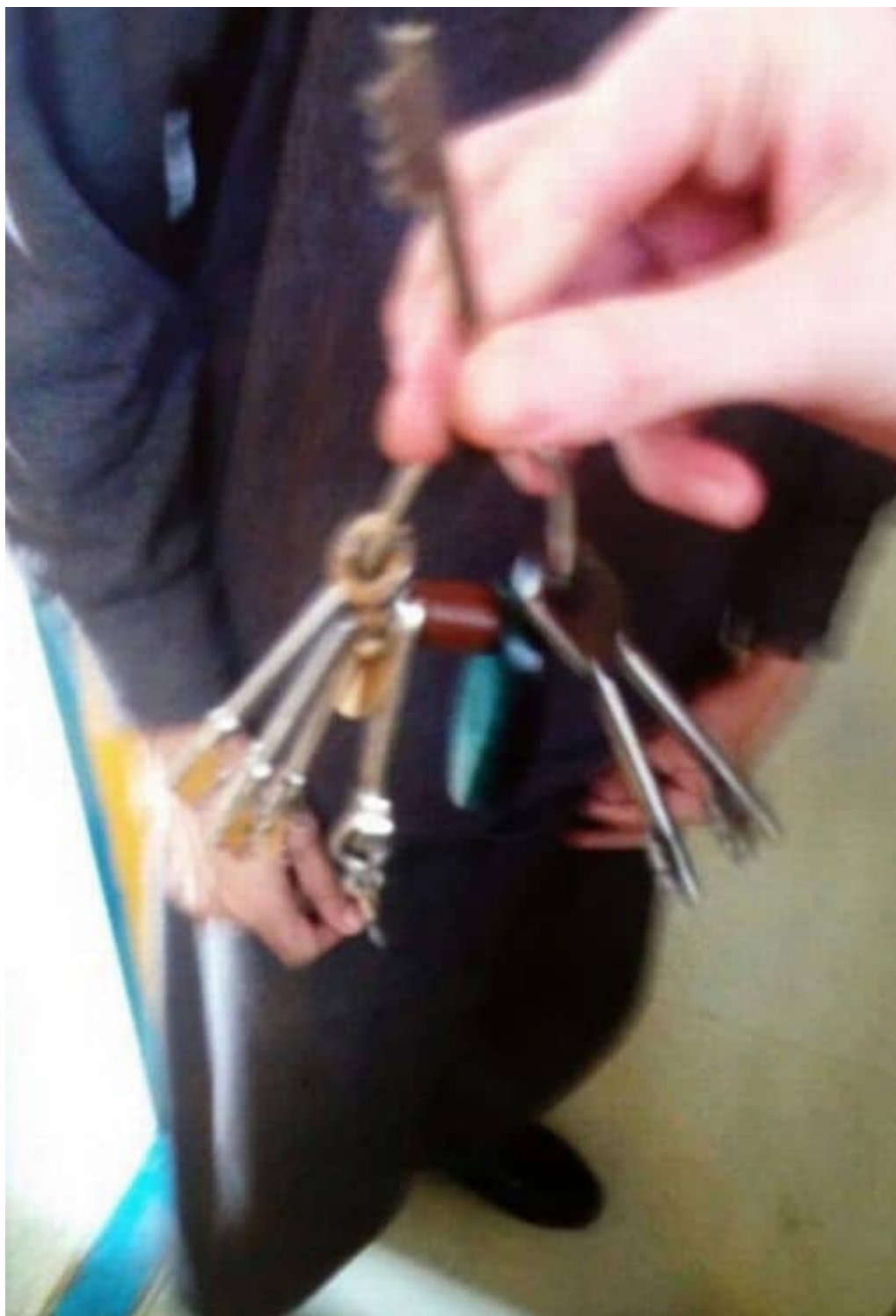
Le chiavi sottratte al secondino

Nel processo sono stati citati vari dettagli della rivolta; un prigioniero ha strappato un mazzo di chiavi da un secondino mentre era distratto. La perdita delle chiavi ha provocato una rapida evacuazione dell'ala. I prigionieri hanno iniziato a liberare gli altri prigionieri, innescando una corsa contro il tempo per uscire dalla prigione. Un singolo cancello esterno che conduceva al portone principale stava tra i detenuti e una possibile evasione in quel momento, ma sfortunatamente i secondini arrivarono al cancello in tempo. Allora scoppio il caos, ci fu un lungo scontro un lungo al cancello tra i secondini antisommossa da un lato e i prigionieri armati di palline da biliardo, vernici e altre armi improvvisate dall'altra. Un televisore lanciato da una finestra manco di poco la testa di un secondino e le palle da biliardo rimbalzarono sui caschi più volte.